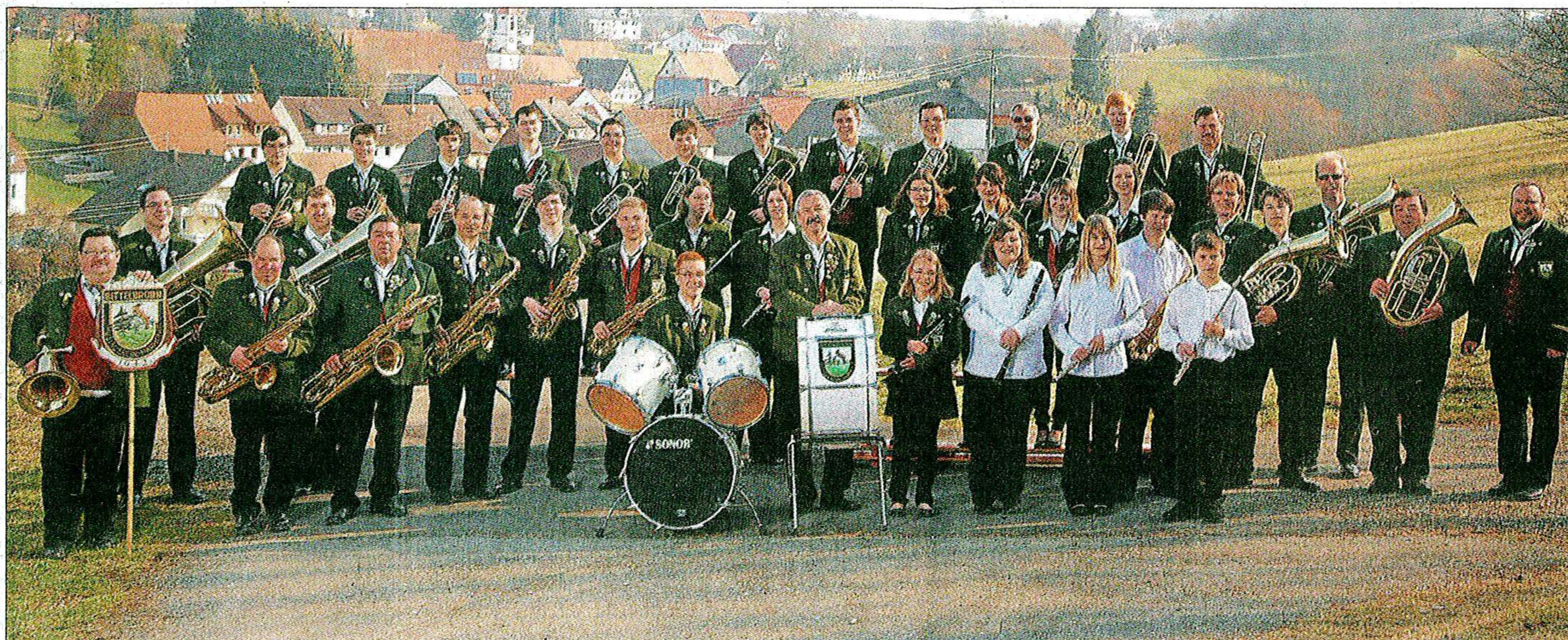
Der Musikverein »Harmonie« Bittelbronn freut sich auf viele Besucher zu seinem Jubiläumsfest.

Los geht das Fest am Samstag, 21. April, um 17 Uhr. Der Fassanstich erfolgt um 18 Uhr, ehe um 18.30 Uhr ein Ehrungsabend folgt. Der Auf-